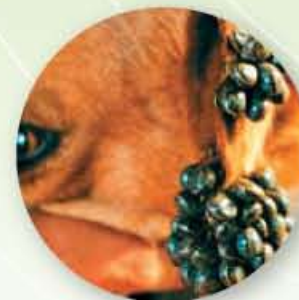
Ухо на куче, опаразитено с кърлежи

Смучейки кръв, те могат да увеличат размерите си до 200 пъти над нормалните. Те могат да причинят инфектиране в мястото на прикрепване към животното, както и анемия при малки животни. Кърлежите са потенциален преносител на причинителите на опасни заболявания - борелиоза (Лаймска болест), ерлихиоза, бабезиоза и др.