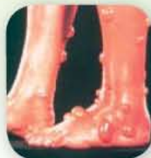
Алергия към ухапване от бълхи при човек