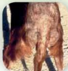
Алергичен дерматит при куче