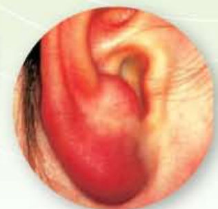
Кожна лимфоцитома на ухото на човек (Лаймска болест)